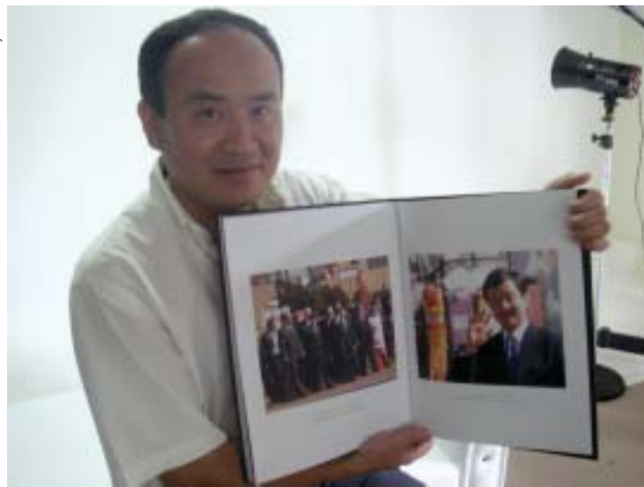
Nonaca tentou retratar o maior número possível de pessoas no livro

"Obrigado portudo" reúne 380 fotos do IMIN-100, tiradas ao longo de quatro anos e selecionadas entre as mais de 18 mil, do período pré-evento e da própria festa. "Acho im-