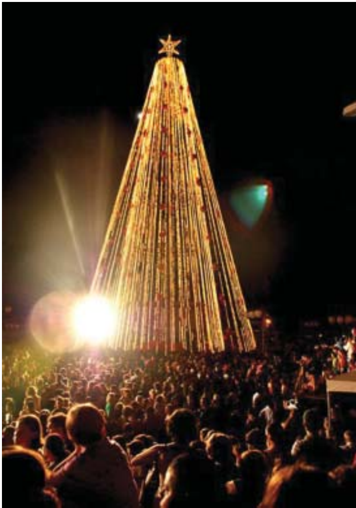
A árvore de Natal tem mais de 40 metros e é uma das maiores do Sul do País