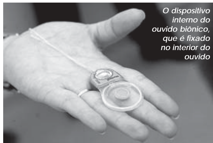
O dispositivo interno do ouvido biônico, que é fixado no interior do ouvido