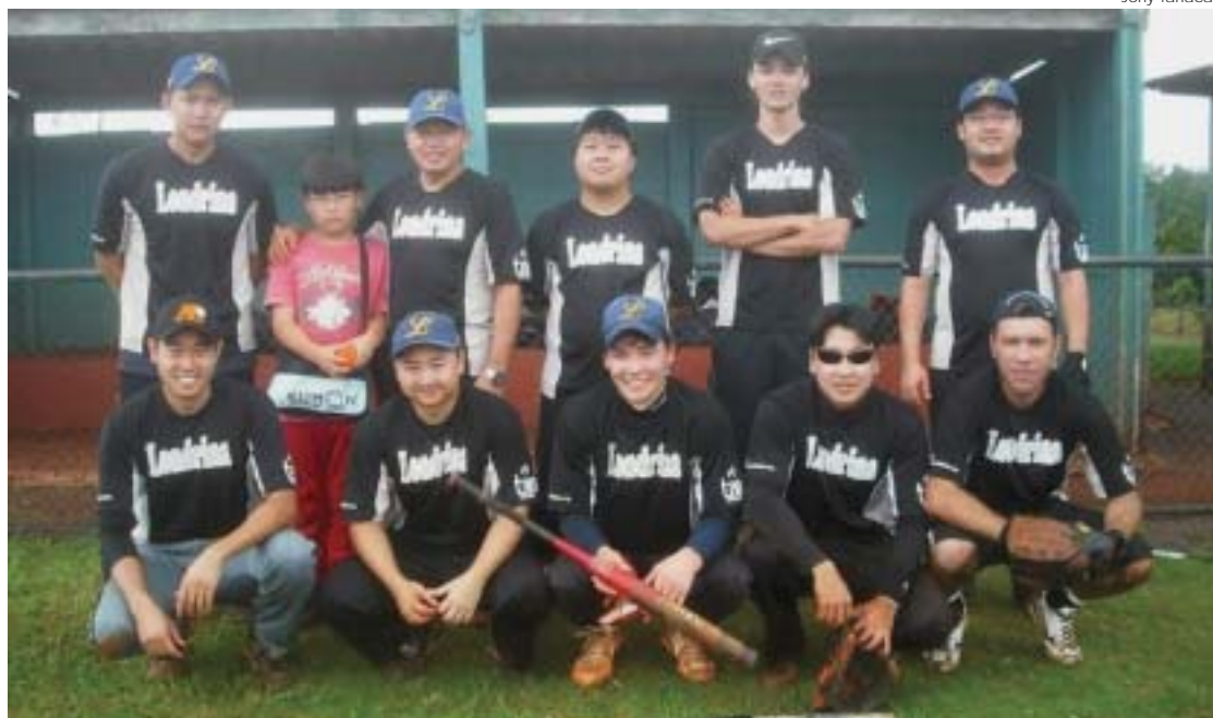
Tan Orthocenter, a campeã da Categoria Adulto