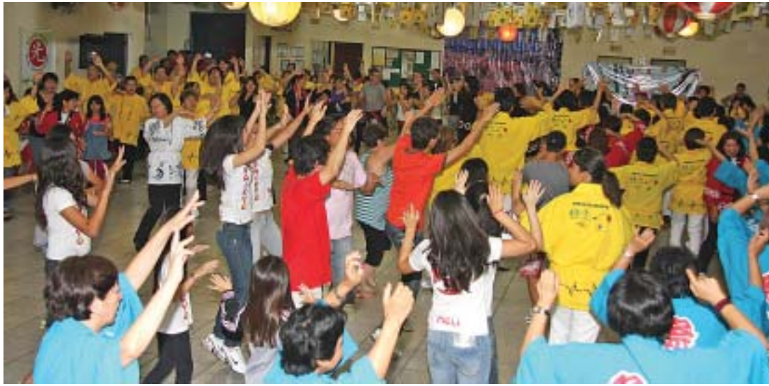
O público participou ativamente do Bon Odori