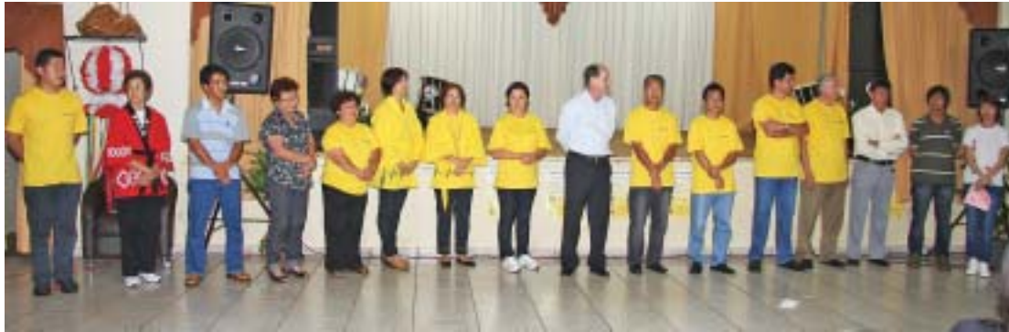
Diversas autoridades prestigiaram a abertura do evento

Projeto itinerante está levando a cultura japonesa para diversas comunidades paranaenses